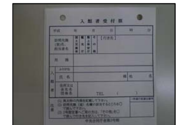
(3号館入館者受付票)